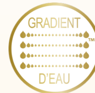
LE GRADIENT D'EAU