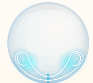
LA GÉOMÉTRIE PRECISION BALANCE 8|4 TM